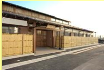
②グループホームゆい