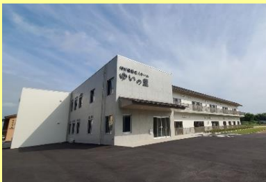
①新特別養護老人ホームゆいの里