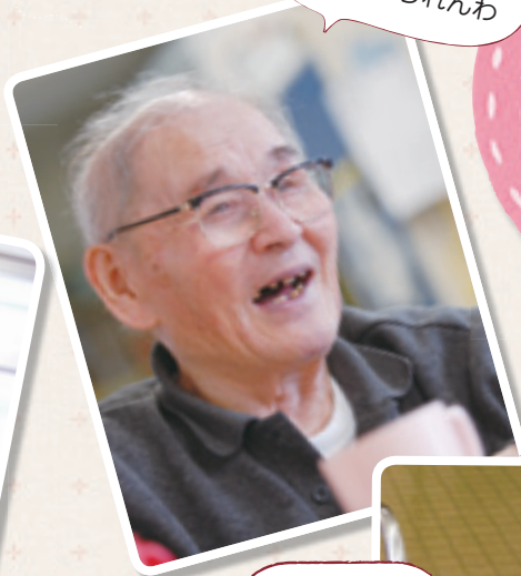
笑わずにはいられんわ