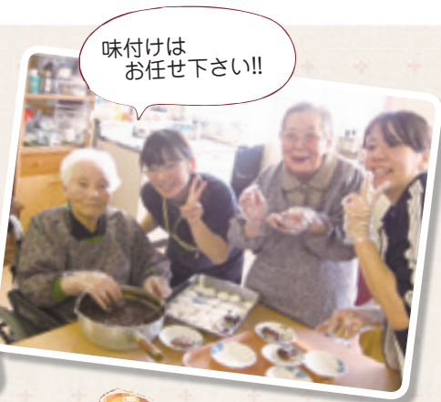
味付けはお任せ下さい!!

ご利用者さまのご家族さまより「普段どお過ごしているの?」「どんな職員さんがいるの?」という声をたくさん頂きました。今回は前号に引き続き、入所サービス部(相談室、介護サービス、健康サービス、栄養サービス)グループホームゆいの紹介です。