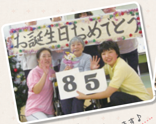
お誕生日おめでとうございます♪