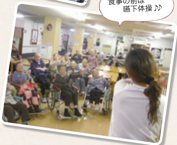
食事の前は嚙下体操♪