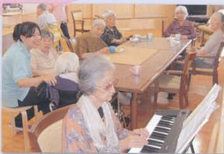
ピアノ演奏を聞きながらのティータイム