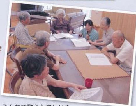
みんなで歌うと楽しいネ。

本当に“マイペース”なんです(笑) まだまだ不十分ですが、これ からも“マイペース”な生活を送 っていただけるよう、笑顔を絶や さず、そしてご利用者様第一優 先の理念を忘れず、頑張ります。