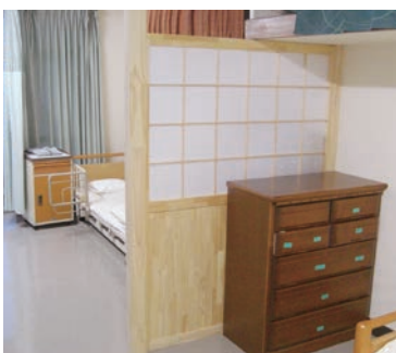
本館・ショートステイ

ベッドとベッドの間に新たにたたてを設けました。4人部屋の中でも、利用者様のプライベートな空間をより確保できるようになりました。