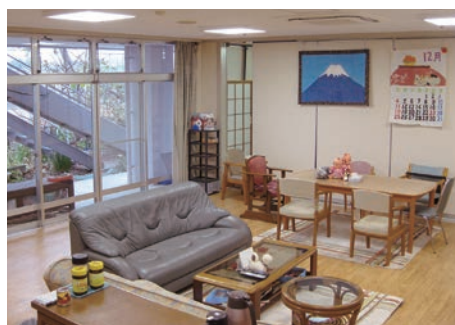
守山デイサービス

ダイニングやトイレの改修をしました。和室仕様の天井や照明、壁の色、段差など以前のお部屋のイメージとはまた違った洋風の作りに生まれ変わりました。