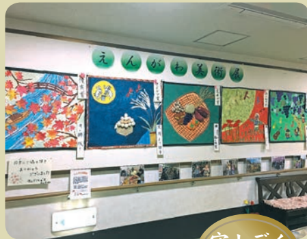
守山デイサービス

利用者様主体の活動に取り組んでいます。アイデアを出し合い、各曜日対抗の壁画作りに挑戦、美術展を開催しました。廊下に作品を掲示し、投票を募ることでたくさんの方に見て頂き、取り組まれた利用者様にも達成感を味わって頂くことができました。