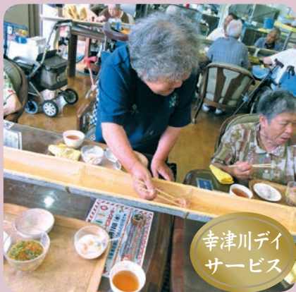
幸津川デイサービス

毎月の目玉行事を企画しています。夏には夏祭りや流しそうめん、秋には焼き芋やさんま焼きをしました。「おいしい!」「楽しかった!」「またしてやあ。」と喜びの声を頂きました。季節を感じて頂けるような利用者様に楽しんで頂ける活動に力を入れています。