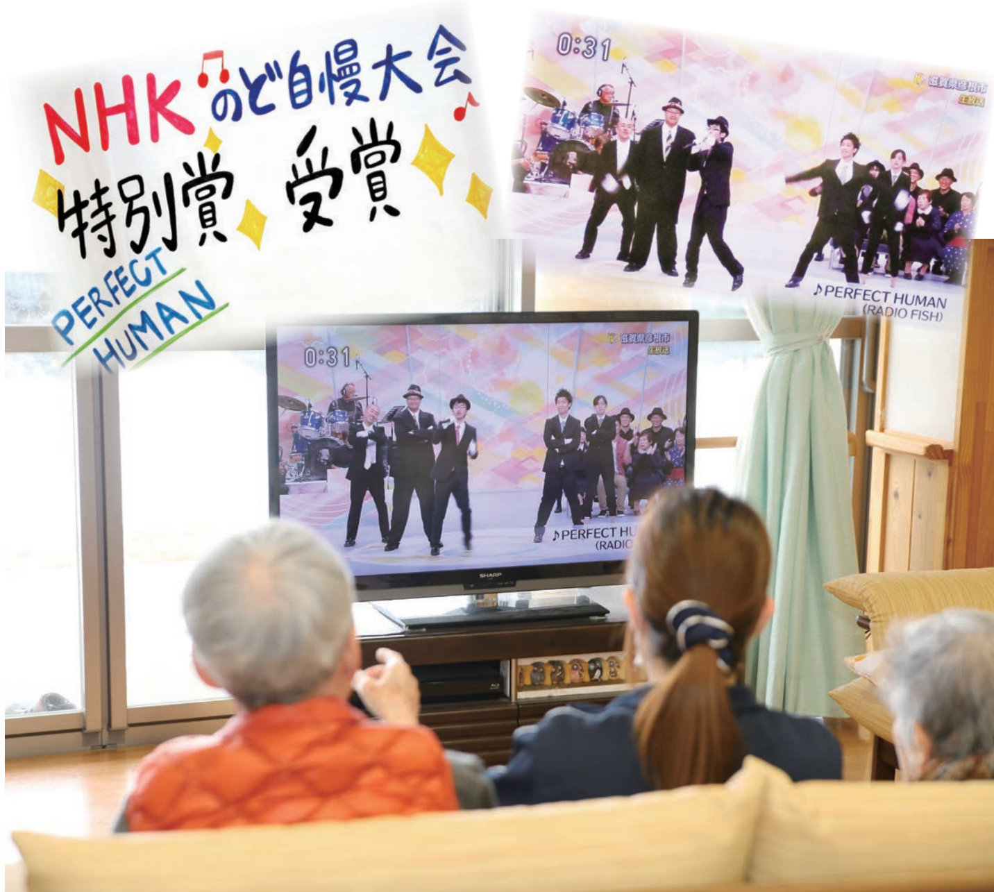
平成28年11月13日『NHKのど自慢大会』に出場し、特別賞をいただきました！！